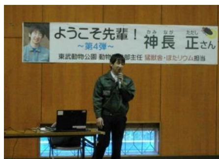
△宮川小学校（春日部市）での講話の様子