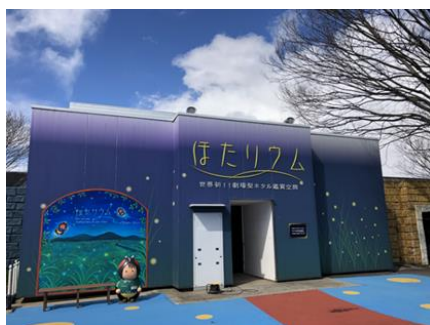
△ほたリウムの外観

ほたリウムは1年間を通してホタルが鑑賞できる世界初の劇場型の施設です。ほたリウム内には本物のホタルが約1万匹生息している大型水槽（L2m×W2m×H3m）があり、ホタルが産卵する陸地と幼虫が生活する水場が再現されています。ほたリウムは、年間を通してヘイケボタルを羽化させる飼育技術確立し、その飼育技術と飼育用装置は、2018年6月15日に特許を取得しました。なお、ほたリウムでは各地での飼育技術指導、講話も実施しています。