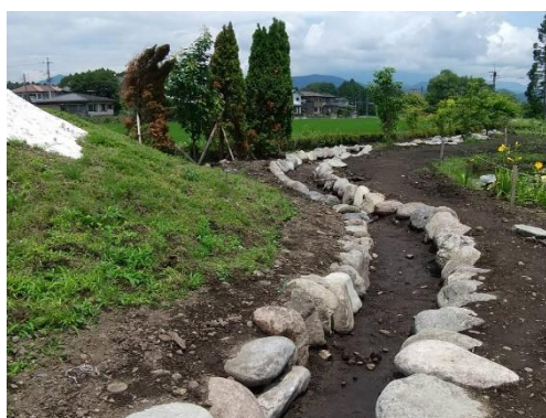
△倉ヶ崎S L花畑の小川（イメージ）