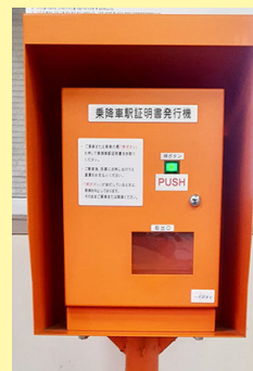
乗降車駅証明書発行機 Certificate of entraining station machine