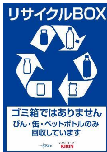
△リサイクルボックス適正利用に向けたPR（イメージ）