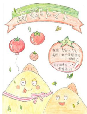
△ 中学生作・販促ポスター