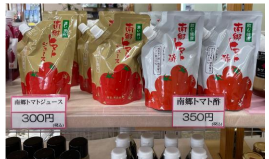
△ 南郷トマトを使った加工品の例