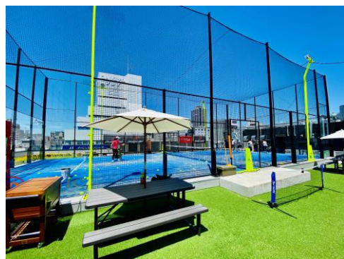
△「パデル東京ミズマチ」イメージ