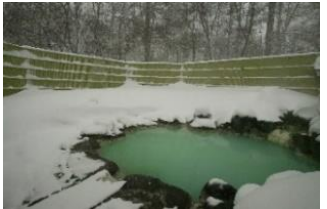
△露天風呂「森乃精」 (日光アストリアホテル)