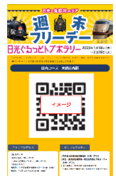
△スタンプポイントに掲示してあるポスター(イメージ)