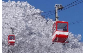
△明智平ロープウェイ