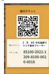
△フリーパスチケット