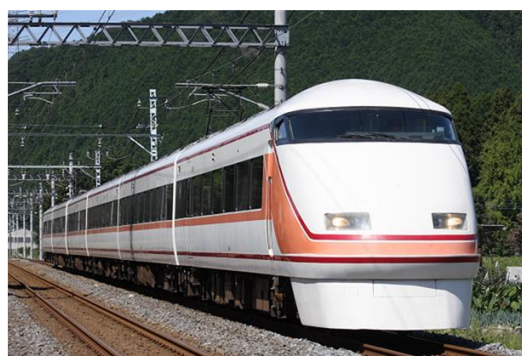
△特急スペーシア八王子きぬ（イメージ）