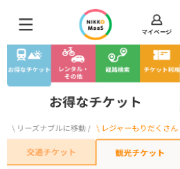
△チケット申込画面