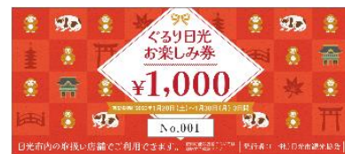
△クーポン券(イメージ)