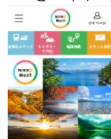
△NIKKO MaaS 画面