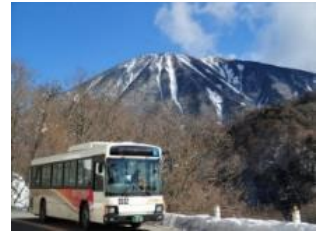
△日光・鬼怒川エリアのバス