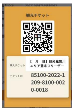
△日光・鬼怒川エリア週末フリーパス（イメージ）