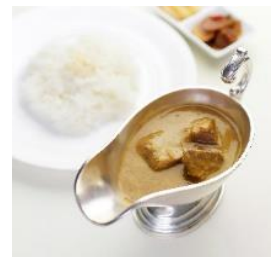
△百年ライスカレー(イメージ)

<その他>東武日光駅ツーリストセンターで購入当日に「日光・鬼怒川エリア週末フリーパス」チケット画面を提示いただき、クーポンをお求めのうえ金谷ホテルへお越しください。