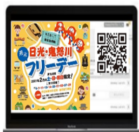
△特設サイトから事前予約申込 (イメージ)

※ 各実施日につきおひとり様5人分まで申込み可能ですが、パスはおひとり様1枚です。（大人、小児それぞれの人数をご入力ください。）