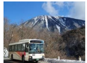
△日光・奥日光エリアのバス