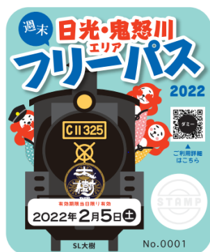
△日光・鬼怒川フリーパス（イメージ）