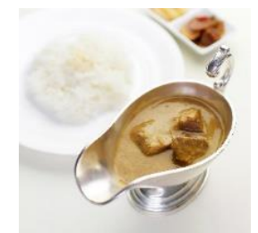
△百年ライスカレー (イメージ)

※ 事前申込可 (購入時に「日光・鬼怒川エリア週末フリーパス」を提示いただきます。)