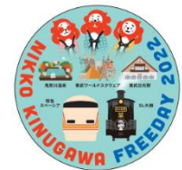
△オリジナル缶バッジ（イメージ） 上：日光エリア 下：鬼怒川エリア