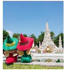
△東武ワールドスクウェア