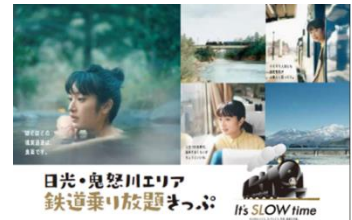
△日光・鬼怒川エリア鉄道乗り放題きっぷ (イメージ)