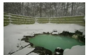
△露天風呂「森乃精」 (日光アストリアホテル)