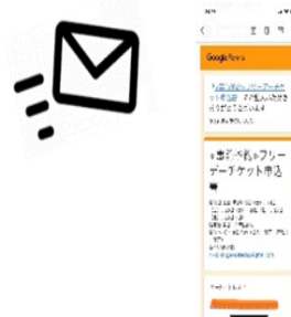
△当日予約完了メール画面を提示 (イメージ)