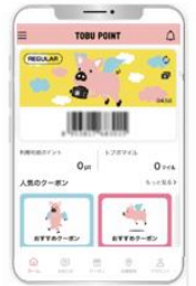
△TOBU POINT アプリ (イメージ)