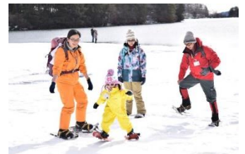
△スノーシューの様子(イメージ)

※ 対象のアクティビティは日光・鬼怒川エリア週末フリーデーの実施日に開催されるものに限ります。