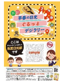
△スタンプポイントに掲示してあるポスター（イメージ）