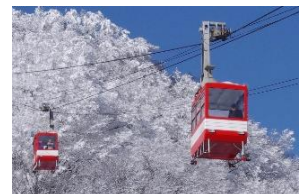
△明智平ロープウェイ