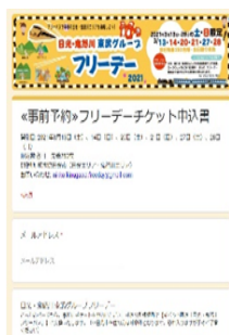
△申込フォームに必要事項を入力して送信 (イメージ)