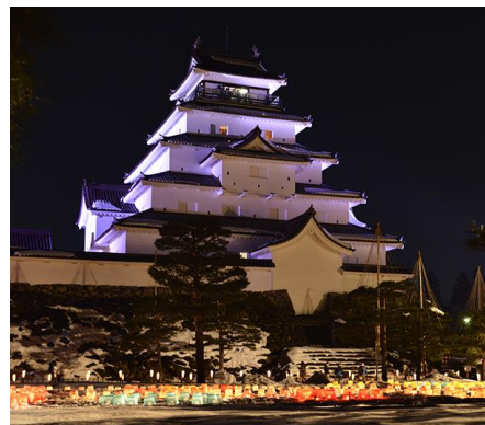
△会津絵ろうそくまつり （イメージ）