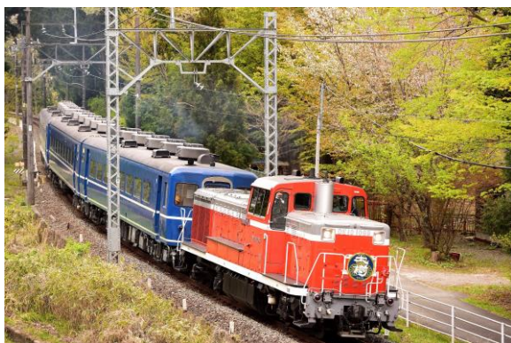
△会津田島駅に乗り入れるDL大樹（DE10 1099）