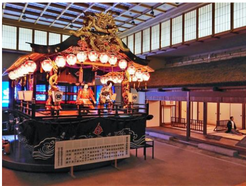
△会津田島祇園会館 (イメージ)