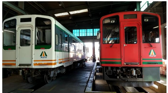
△会津鉄道車両基地 (イメージ)