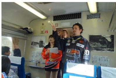
△過去の車内の様子

SL大樹1号・2号・5号に日光アイスバックスの選手、オフィシャルサポーターズユニフォーム「ICEGIRLS」が乗車し、お客様とのトークショーや記念撮影等を実施します。