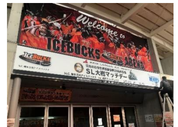
△マッチデー (イメージ)