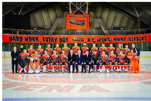
△H. C. 栃木日光アイスバックス