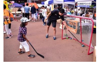
△シュート体験教室の様子 (イメージ)