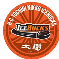
△オリジナルヘッドマーク (イメージ)

当日運行するSL大樹1号・2号・5号・6号に日光アイスバックスとSL大樹がコラボレーションしたオリジナルヘッドマークを掲出します。