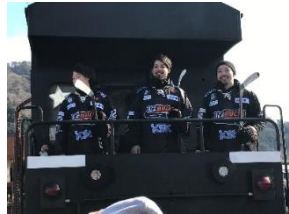
△転車台回転時の様子