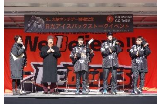
△トークショーの様子 (イメージ)