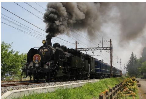
△東武日光へ向けて走るSL大樹ふたら