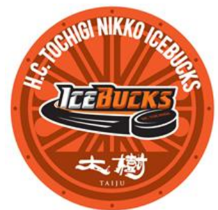
△オリジナルヘッドマーク （イメージ）