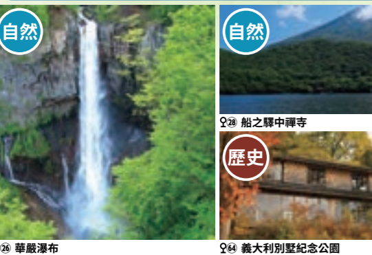
Q26 華嚴瀑布 Q46 義大利別墅紀念公園 Q45 湯元溫泉 Q28 船之驛中禪寺 Q37 龍頭瀑布 Q83 日光東照宮陽明門 Q82 日光山輪王 Q24 明智平 Q81 東照宮東參道入口 清見苑酒店前 Q7 日光二荒山神社 神橋