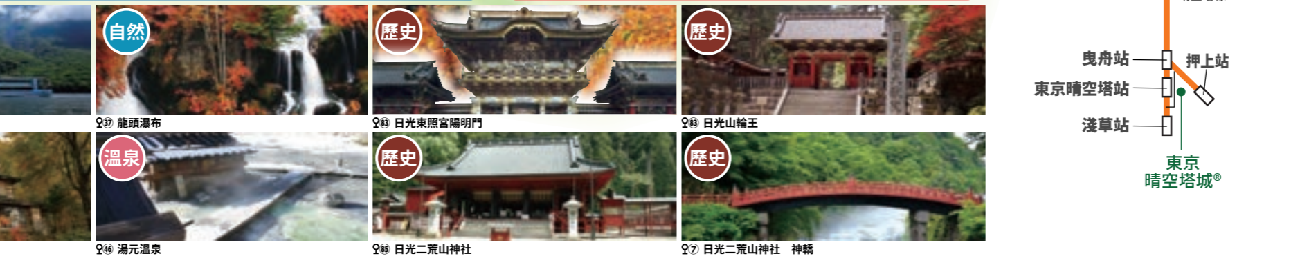
Q26 華嚴瀑布 Q46 義大利別墅紀念公園 Q45 湯元溫泉 Q28 船之驛中禪寺 Q37 龍頭瀑布 Q83 日光東照宮陽明門 Q82 日光山輪王 Q24 明智平 Q81 東照宮東參道入口 清見苑酒店前 Q7 日光二荒山神社 神橋